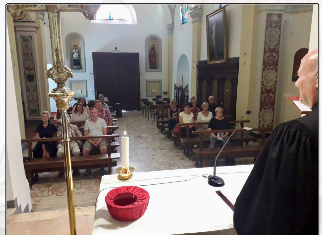
Culto d'estate a Cerro 17-08-24 Sommergottesdienst in Cerro