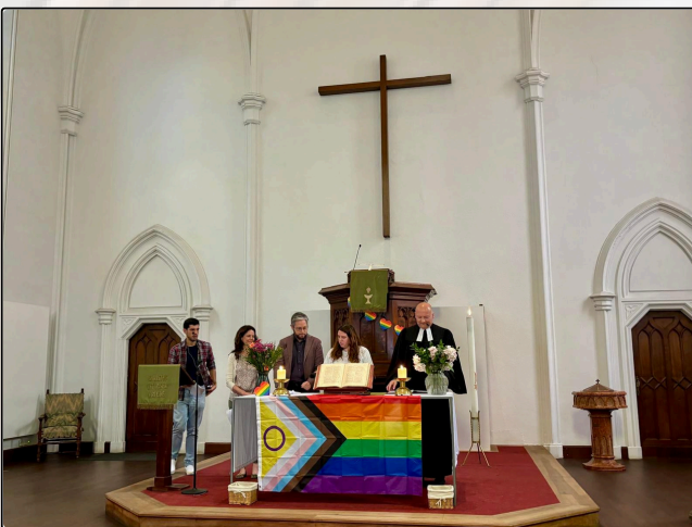
Regenbogengottesdienst 09-06-24 Culto dell' arcobaleno