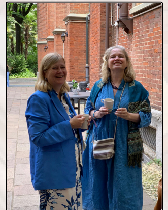
Gottesdienst und Fest zur Übergabe der Präsidentschaft 16-09-24

Culto e festa per il passaggio di consegne della presidenza